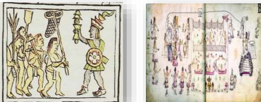
Figura 3. Códice Florentino y Códice Azcatitlan: Instrumentos y Técnicas de pesca.

se difundía en el agua y provocaba que los peces se aturdieran y salieran a la superficie para ser recogidos con gran facilidad.