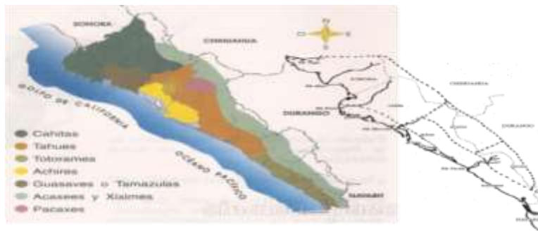
Figura. 1. Principales grupos indígenas del territorio Sinaloense en el año 1530

En 1530, los europeos clasificaron a los grupos indígenas e incluso les pusieron nombre con base en los rasgos culturales que observaron además del idioma, pero también catalogaron a las poblaciones tomando en cuenta la vertiente Occidental de la sierra Madre, la región entre el Centro de Nayarit y el Río Yaqui. Estas poblaciones costeras fueron divididas en 6 provincias indígenas: Sentispac, Aztatlán, Quezalá, Piaxtla, Culiacán y Petatlán/Sinaloa en donde se localizaban los grupos étnicos (Ortega, 1999) (Fig.1):