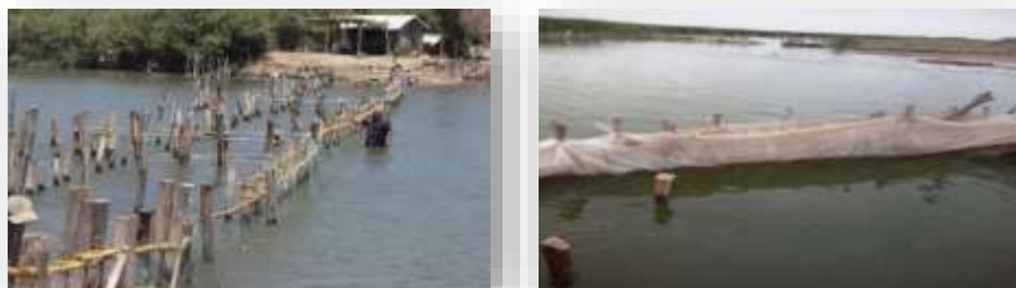
Figura 2. Tapos en las comunidades del municipio de Escuinapa.

Según Ortega (1999), los pescadores totorames conocieron una técnica de captura que aún en nuestros días tiene buenos resultados en algunas comunidades del municipio de Escuinapa y que llaman pesca de los "tapos" (Fig. 2). Consiste en aprovechar las entradas que tiene el mar en el litoral, donde forma numerosas lagunas y esteros que se inundan al subir la marea. Antes de que empiece el descenso de las aguas, los pescadores extienden una cortina hecha de cañas fuertemente atadas con la que tapan la boca de la laguna; el agua fluye por los intersticios de las cañas mientras que los peces y camarones quedan atrapados en el estero, y basta recolectarlos. En la costa de Escuinapa se han localizado grandes depósitos de concha, principalmente de ostión, testimonio del amplio consumo de los totorames de este molusco (Grave, 2002).